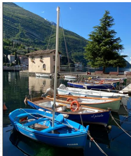
Das „neue“ Zollhaus am Hafen in Torbole