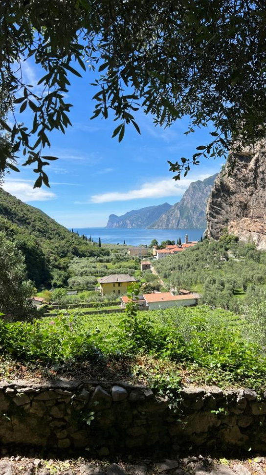
Blick auf Torbole