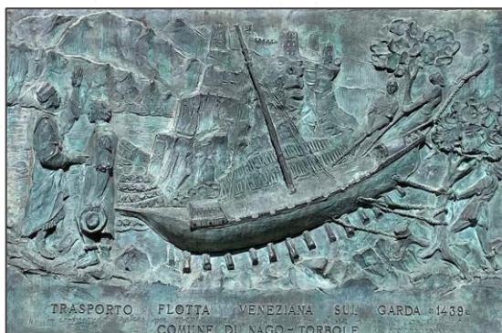
Gedenktafel am Fußweg zum See

Über drei Monate dauerte dieser einzigartige Transport bis die ersten Schiffe bei Torbole wieder zu Wasser gelassen werden konnten. Nach Seeschlachten bei Riva und Maderno gelang es den Venezianern