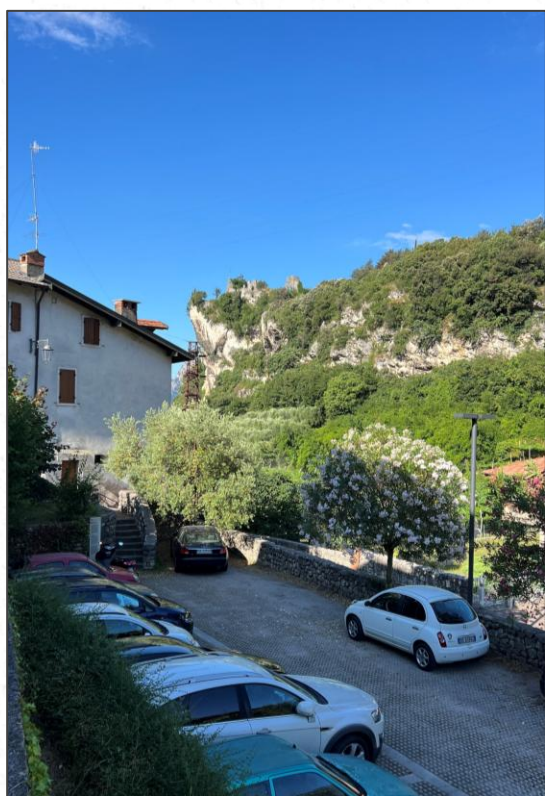
Der Parkplatz, im Hintergrund links ist das Zollhaus

In beiden Wohnungen gibt es WLAN mit einer guten schnellen Internetanbindung, eine Stereoanlage mit Bluetooth und ein TV.