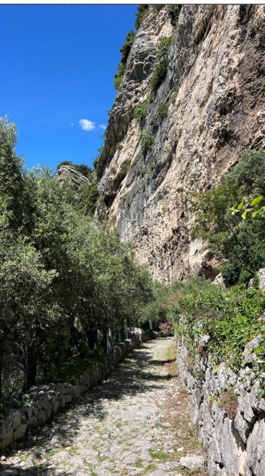
Der Weg führt unterhalb der Felswände und der Burg Penede entlang.

Im Jahr 1439, ungefähr 100 Jahre vor dem Bau des Zollhauses, wurde hier eine Flotte venezianischer Galeeren von Venedig aus über die Etsch, dann auf dem Landweg über den San Giovanni Pass und das Tal „Valle Santa Lucia“ hinunter zum Gardasee gebracht, um den Mailändern ihre Vorherrschaft über den Gardasee streitig zu machen.