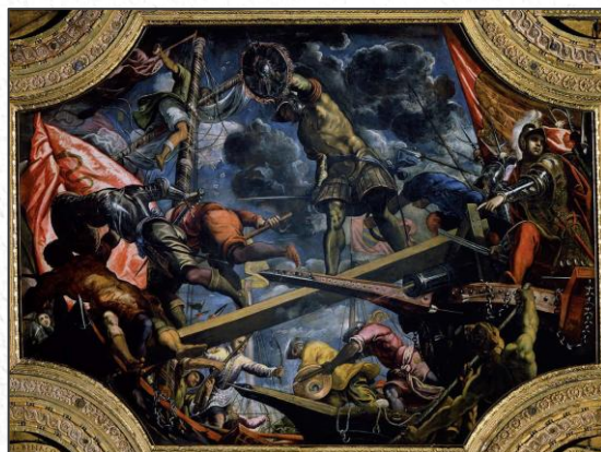
Ein Gemälde der Seeschlacht bei Riva im April 1440 befindet sich in Venedig im Dogenpalast.

Der wunderschöne Weg durch das Valle Santa Lucia existiert auch heute noch. Über einen kleinen Weg erreicht man vom Zollhaus aus zu Fuß in ca. 15 Minuten Torbole und den See.